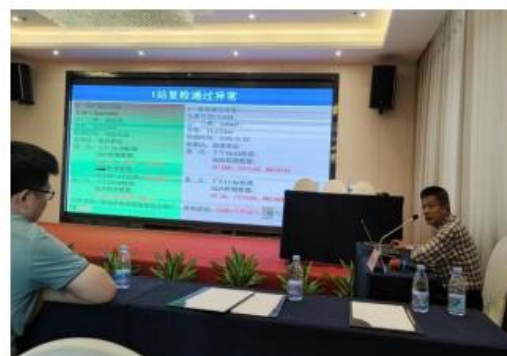
张立峰部长简读标准